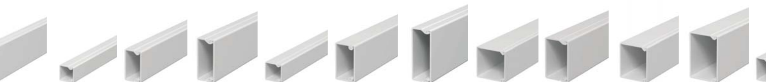
Tabela doboru WDK