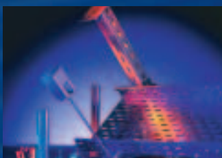
Functiebehoud- en MLAR-systemen