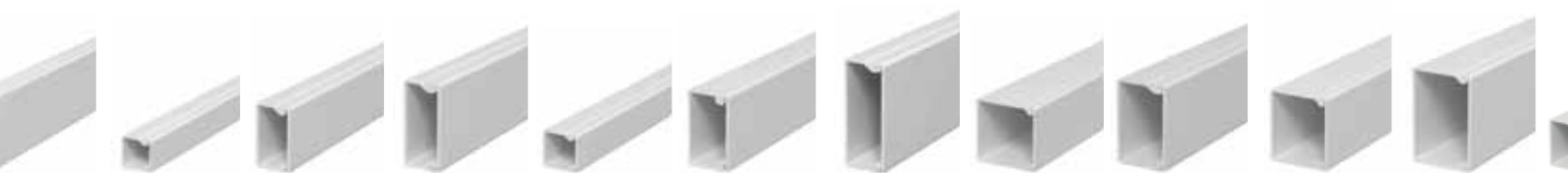
Tabella per la scelta prodotti WDK